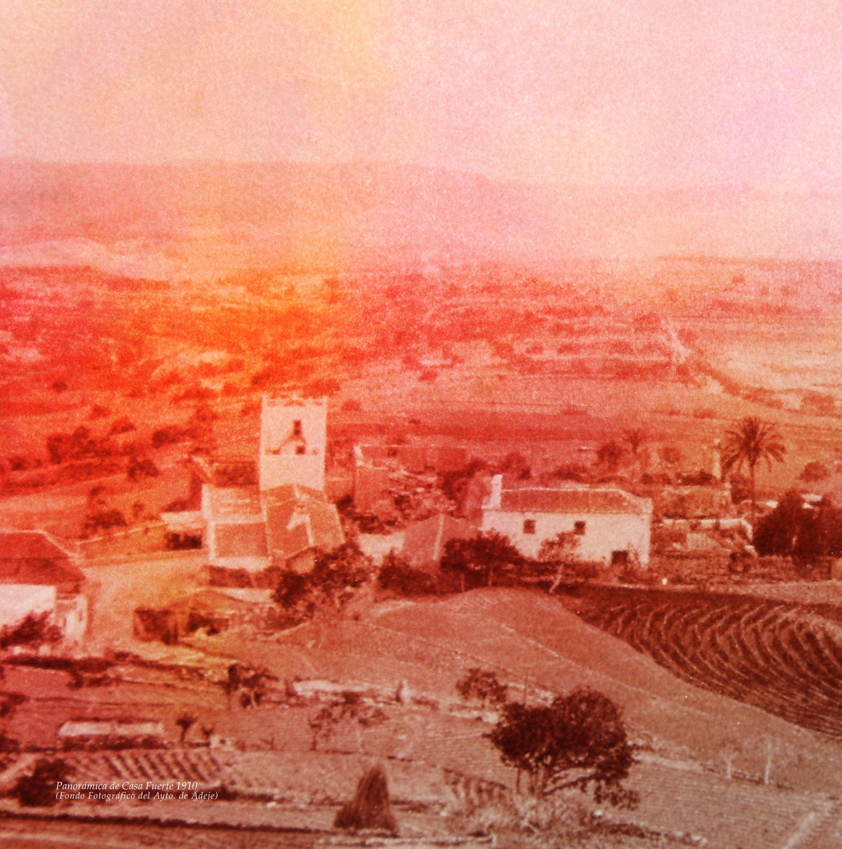
Panorámica de Casa Fuerte 1910