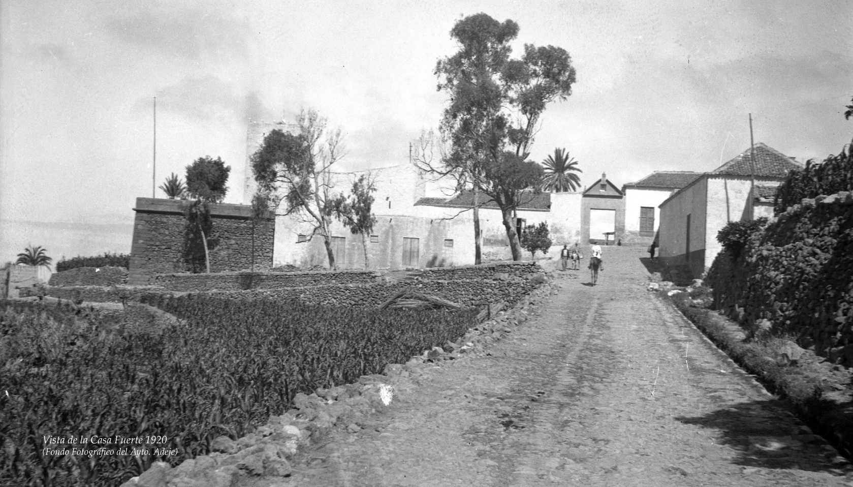
Vista de la Casa Fuerte 1920

jurisdiccionales a la nación en 1811, eliminando definitivamente el régimen señorial, eligiendo a partir de este momento los vecinos sus autoridades, a raíz de la creación de los primeros ayuntamientos constitucionales.