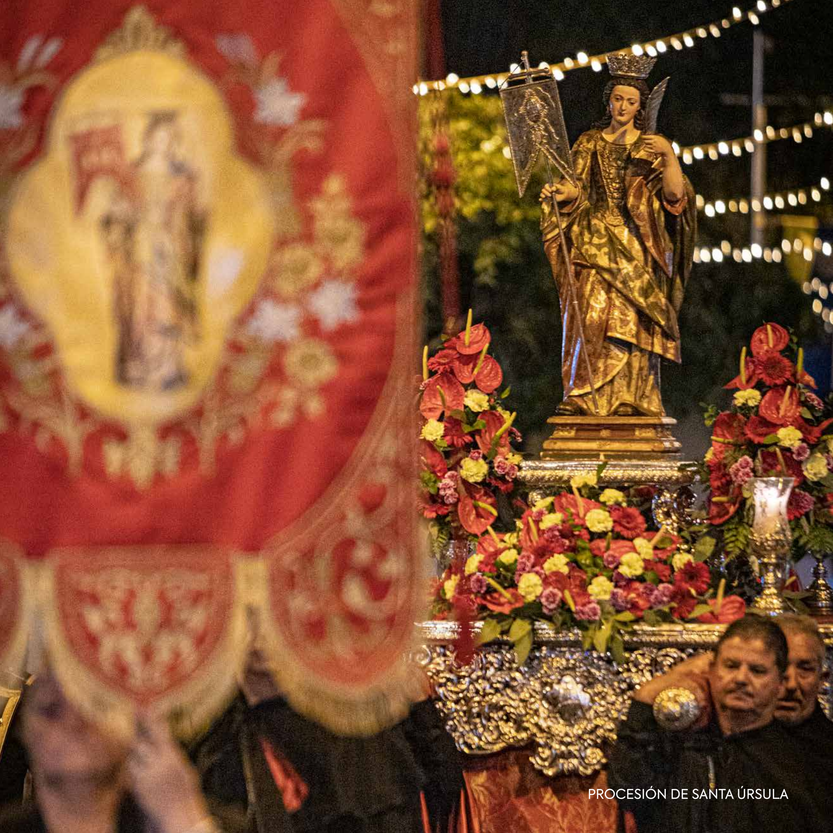
PROCESIÓN DE SANTA ÚRSULA