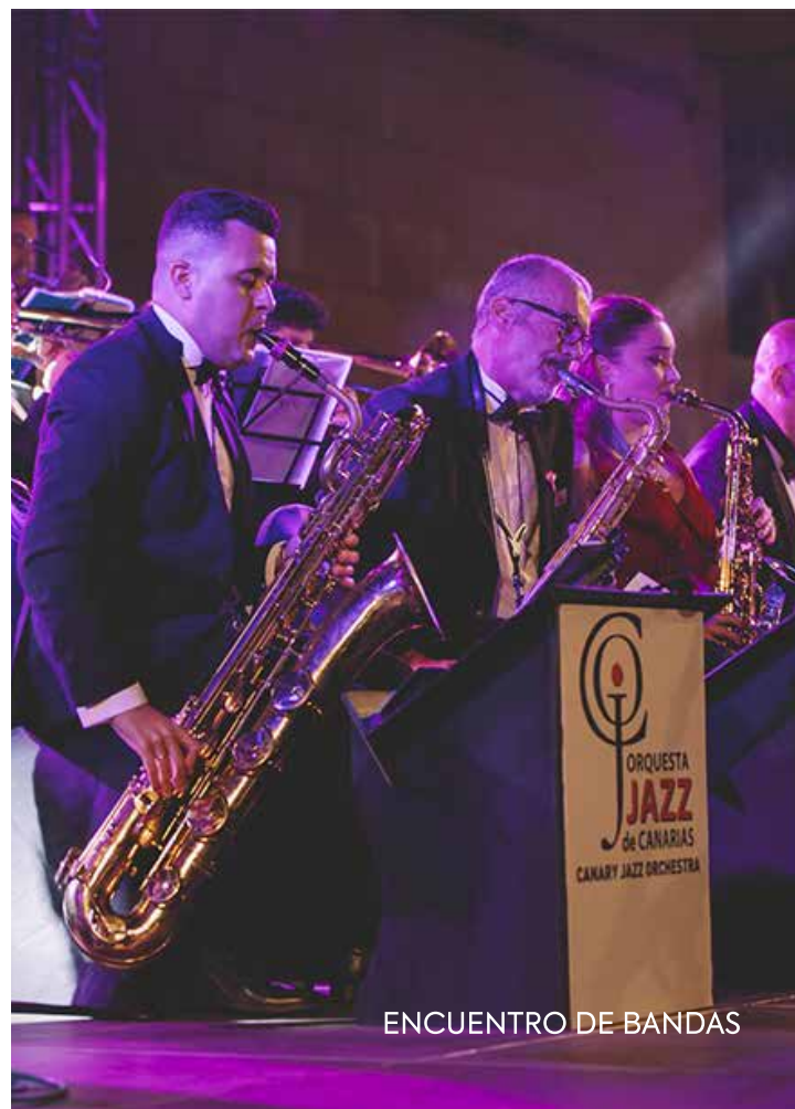
ENCUENTRO DE BANDAS