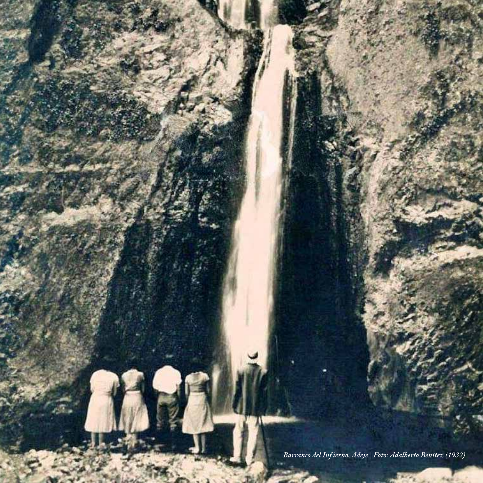
Barranco del Infierno, Adeje (1932)