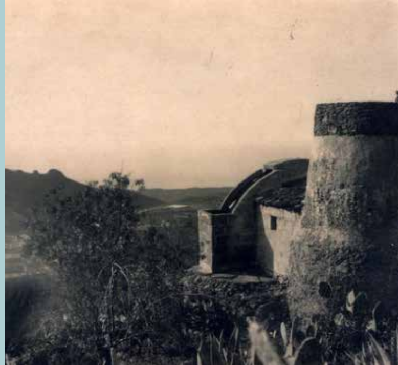
Molino de Arriba

Tras la conquista, ante la necesidad de que parte de la zona Sur de Tenerife se poblase, Alonso Fernández de Lugo repartió en su totalidad nacientes de agua, con la tierra que permitiese regar a «personas poderosas».